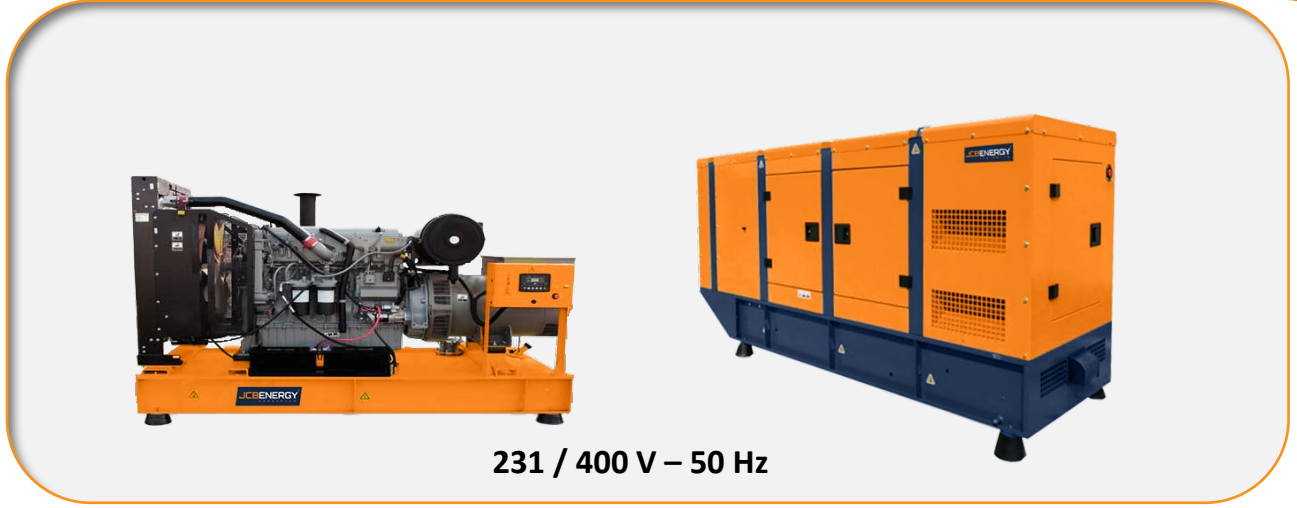
231 / 400 V – 50 Hz